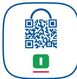
L'icona del launcher