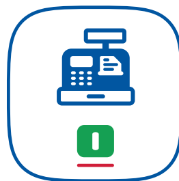
L'icona del launcher