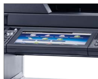
Display touch da 7" con inclinazione fino a 20°