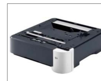
Grande capacità di carico carta fino a 2.600 fogli