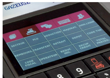
Clavier ergonomique et configurable