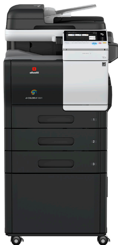
Konfiguration mit 2 optionalen Papierkassetten und Unterschrank