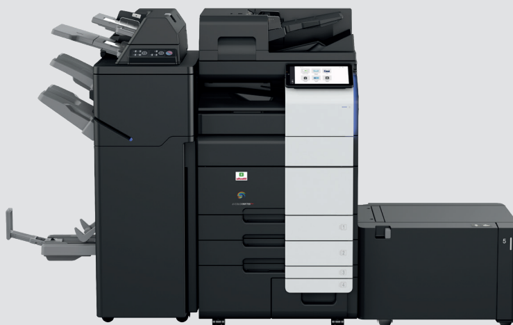
Configuration avec module de finition FS-540SD équipé du Post inserter PI-507, unité de connexion RU-519 et magasin papier latéral LU-205