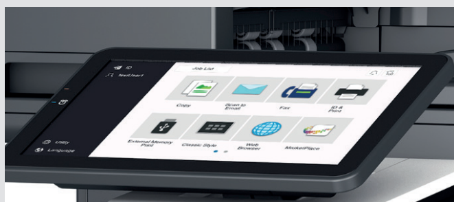
PANTALLA TÁCTIL A COLOR DE 10.1"