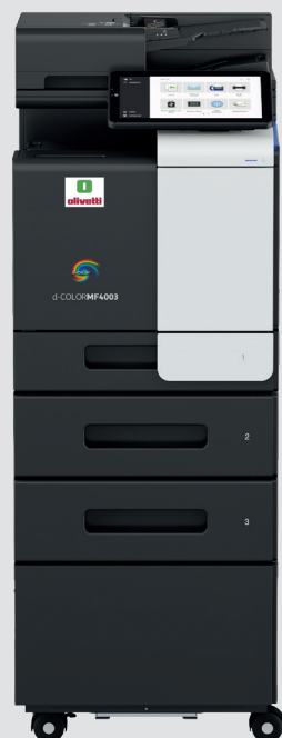
CONFIGURACIÓN CON PEDESTAL Y DOS CASSETTES OPCIONALES