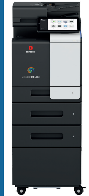
CONFIGURACIÓN CON PEDESTAL Y DOS CASSETTES OPCIONALES