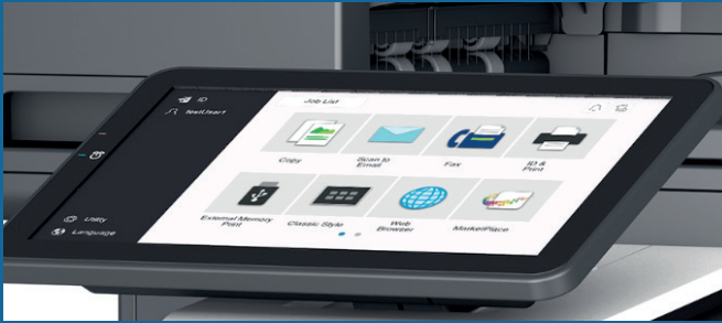
PANTALLA TÁCTIL A COLOR DE 10.1"