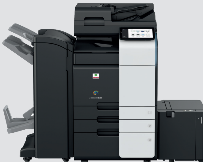
d-Color MF309 con DF-714+PC-416+LU-302+RU-513+FS-536SD