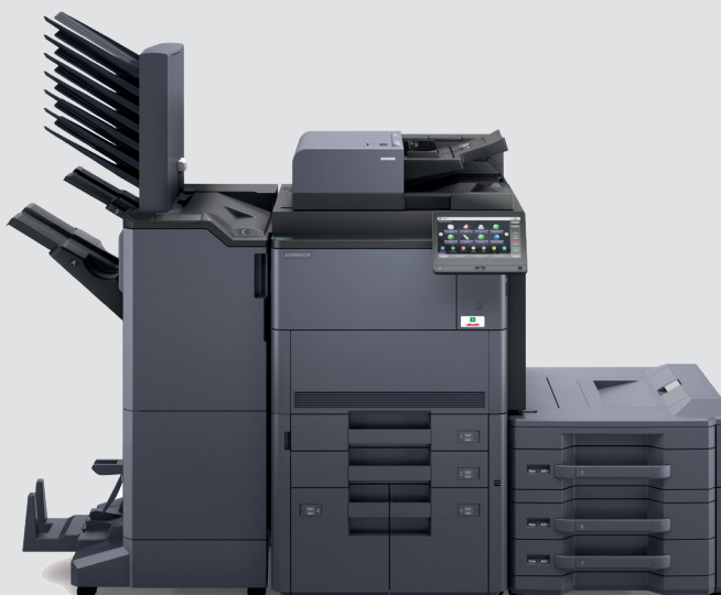
Configuration avec PF-730+PF-7130+DF-7110+MT-730+BF-730