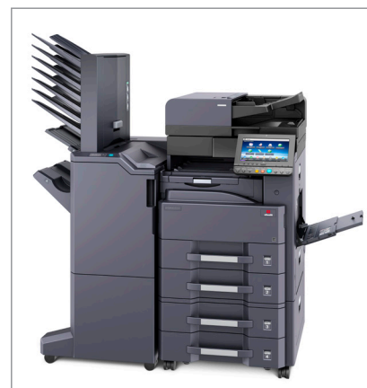
d-Copia 3201MF (bzw. d-Copia 4001MF) + DP-7110 + PF-791 + DF-7110 + AK-740 + MT-730(B)