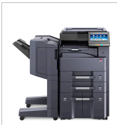
d-Copia 3201MF (bzw. d-Copia 4001MF) + Abdeckung Typ (E) + PF-810 + DF-7120 + AK-740