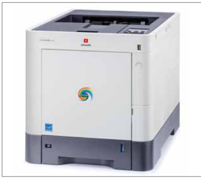
Compatta ed elegante