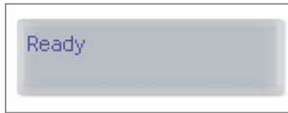
Pannello operatore LCD a 2 linee Porta USB per stampa diretta da chiavetta