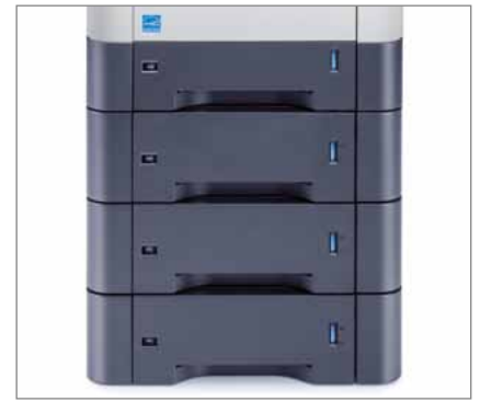
Gestione carta flessibile