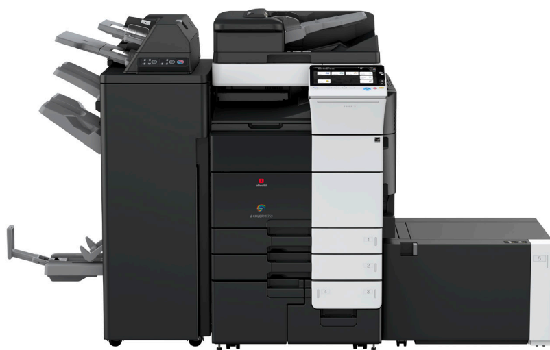
Konfiguration mit Finisher FS-537SD in Kombination mit Deckblatt-Einheit PI-507, Übergabe-Einheit RU-515 und seitlichem Papiermagazin LU-205