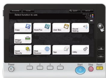
Pantalla táctil a color de 10.1” con autenticación NFC