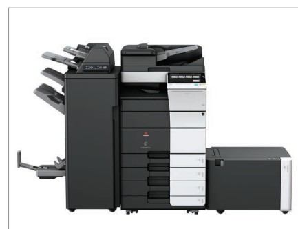
Configurazione con finisher SF-537SD, con post-inserter PI-507 e unità di connessione RU-513, cassette PC-215, cassetto laterale LU-207