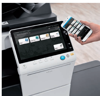
Nuovo touch panel da 10,1" e area di autenticazione NFC