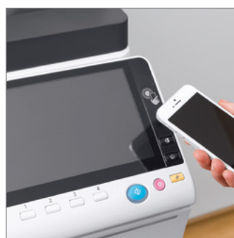
Nueva área para autenticación con Near Field Communication (NFC)