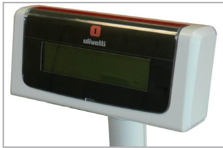
Display cliente grafico remotizzato