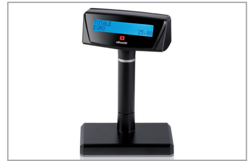
Display alfanumerico mono e bifaccia