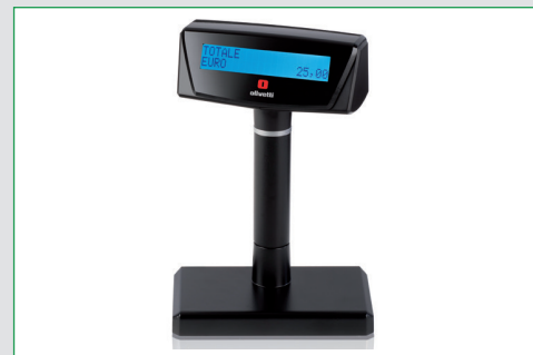
Display alfanumerico mono e bifaccia