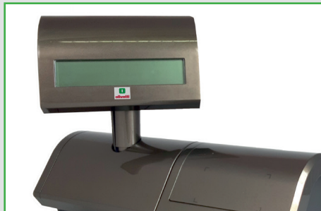
Display cliente sollevabile e ruotabile