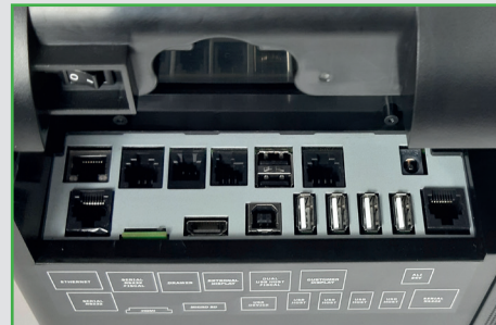
Ampia scelta di connessioni