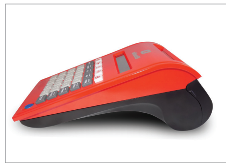
Compacité, design épuré et moderne