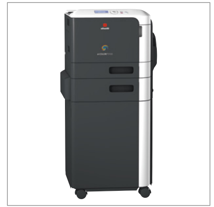
3 Bandejas de papel