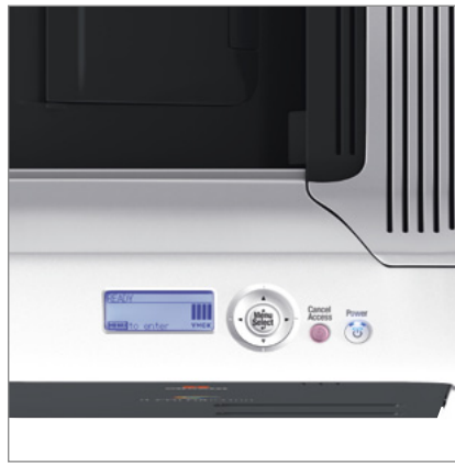
Panel de control LCD con 4 líneas