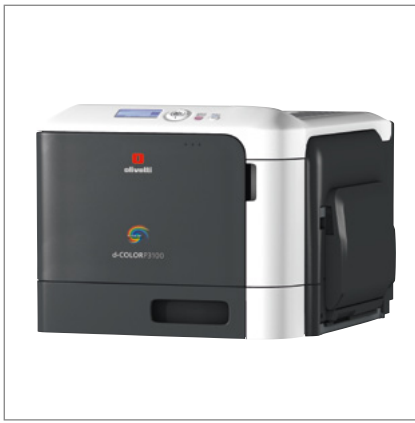
Impresora profesional con diseño elegante